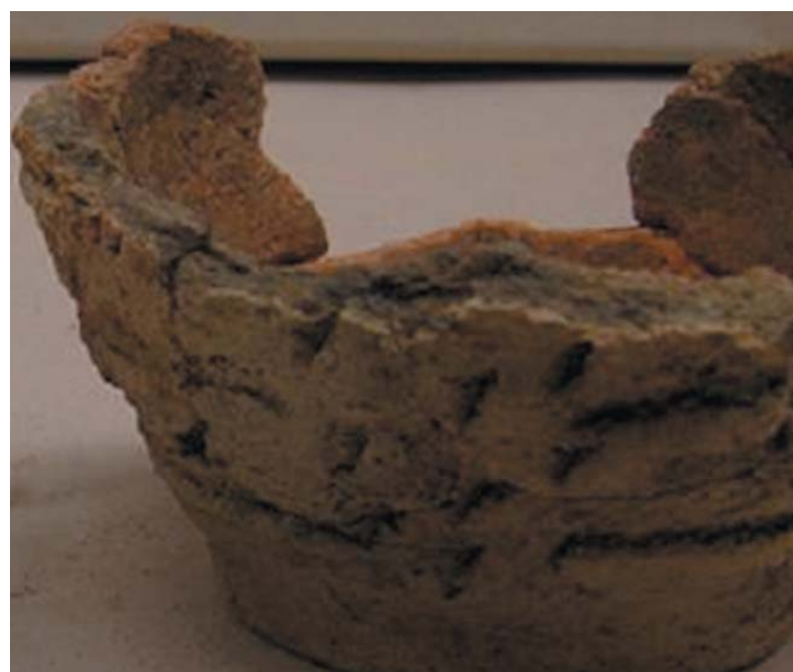
Figuur links: Voorbeeld van verschillende variabelen binnen een sample. Figuur rechts: Urn met Kalenderbergversiering uit graf 5.